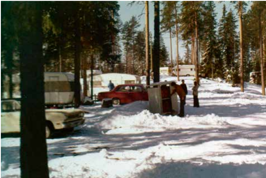
Laakasalon talvipäivillä riitti lunta vuonna 1974

syksyllä jo 2 markkaa litralta?” Samaan hengenvetoon tosin todetaan, etteivät karavaanarit vielä olleet asiasta kovin huolissaan, vaan ”Keimolaan mennään toukokuussa joukolla- ellei nyt sitten eteen löydä todella kovia esteitä”.