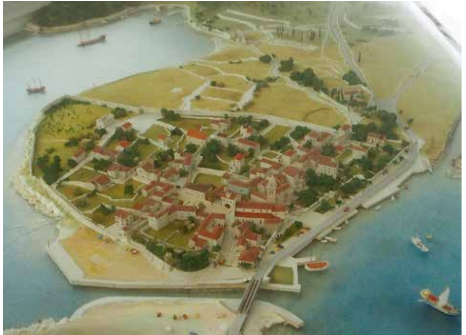
Osorin kaupungin pienoismalli

Käytiin kaupunkikierroksen päälle uimassa rannassa, joka sekin oli kuin meitä varten. Kukkivan olianteripuskan vieressä oli siisti pukeutumiskoppi vessoineen ja suihkuineen. Ei muita uimareita. Paikkaa rajasi kaupungin ikivanha muuri ja kanaali. Poukamassa oli kirkastakin kirkkaampi vesi ja nopeasti syvenevä kivipohja. Vain värikkäät kalat tekivät seuraa. Siis pikkuparatiisi ilman mitään turhaa. Ratkaisu syntyi spontaanisti. Mennään sillan yli Preko Mostaan anomaan lisää aikaa. Näin tapahtui ja tulos oli positiivinen. Valitsemamme ylätasannepaikka oli meidän niin kauan kuin halusimme. Syksyllähän ei ollut turistitungosta toisin