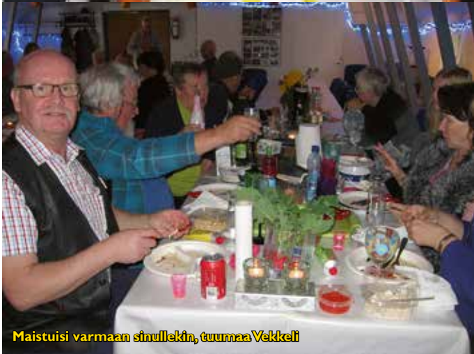
Maistuisi varmaan sinullekin, tuumaa Velkkeli