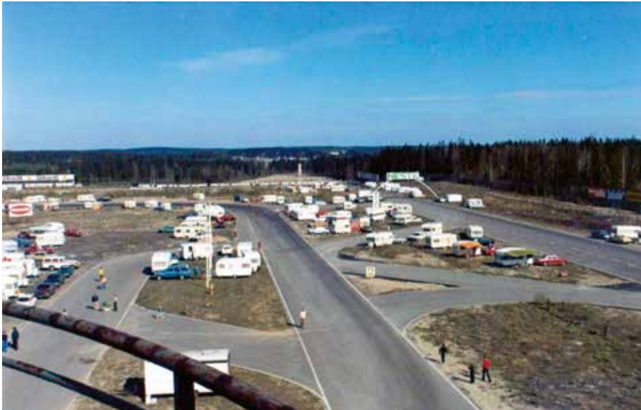
Treffikuvaa Keimolan juhlatreffeiltä toukokuussa 1974