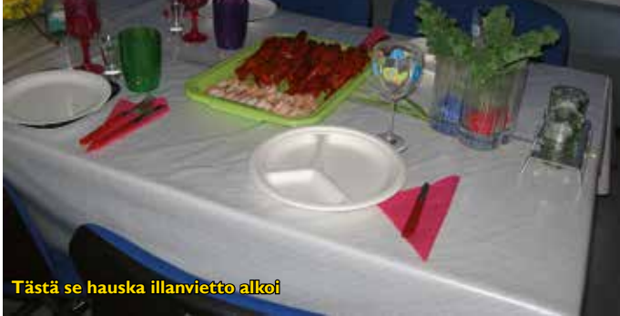
Tästä se hauska illanvietto alkoi