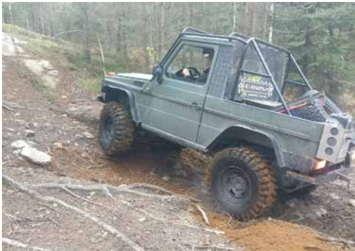
Mersu näyttää tietä.

Tässä vaiheessa aloin jo miettimään, että voisi suunnitella pois lähtemistä vielä kun kalusto on kohtuuehjä. Reittivalinnan takia tuokin oli hieman haastavaa. Koska sieltä ei ollut helppoa reittiä pois pääsemiseksi. Mutaliejua ei onneksi ollut, mutta isoja kiviä sitäkin enemmän. Helmat hieman hipoo kiviä kun matka etenee hissukseen. Mersulla eteneminen ei teetä ongelmia. Lopulta tulee melkoinen kallionousu missä kattelen kuinka Mersun kaikki renkaat suti tyhjää ja laitos lähtee vauhdilla kaartamaan oikealle. Tässä kohtaa mietin jo, että nyt se kippaa ympäri. Osaava kuski saa homman kuitenkin hallintaan ja lähdetään Mersulla hakemaan uutta ajolinjaa. Oikea ajolinja kun löytyy niin tuo melkoinen kallionou-