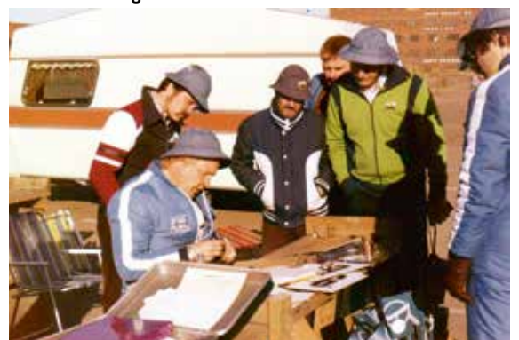
Vuonna 1974 järjestettiin myös merkkiuorisajot, tässä kirjataan tuloksia Helsingin seudun kerhon tilaisuudessa

Nostetaan lisäksi ”Kiitellen Keimolasta” otsikon alta löytyvä muutama juttu. Jutun kirjoittaja oli seurannut treffijärjestelyitä