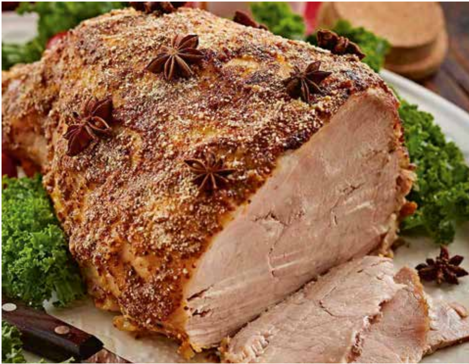
Kinkku on osa joulun ruokaperinnettä