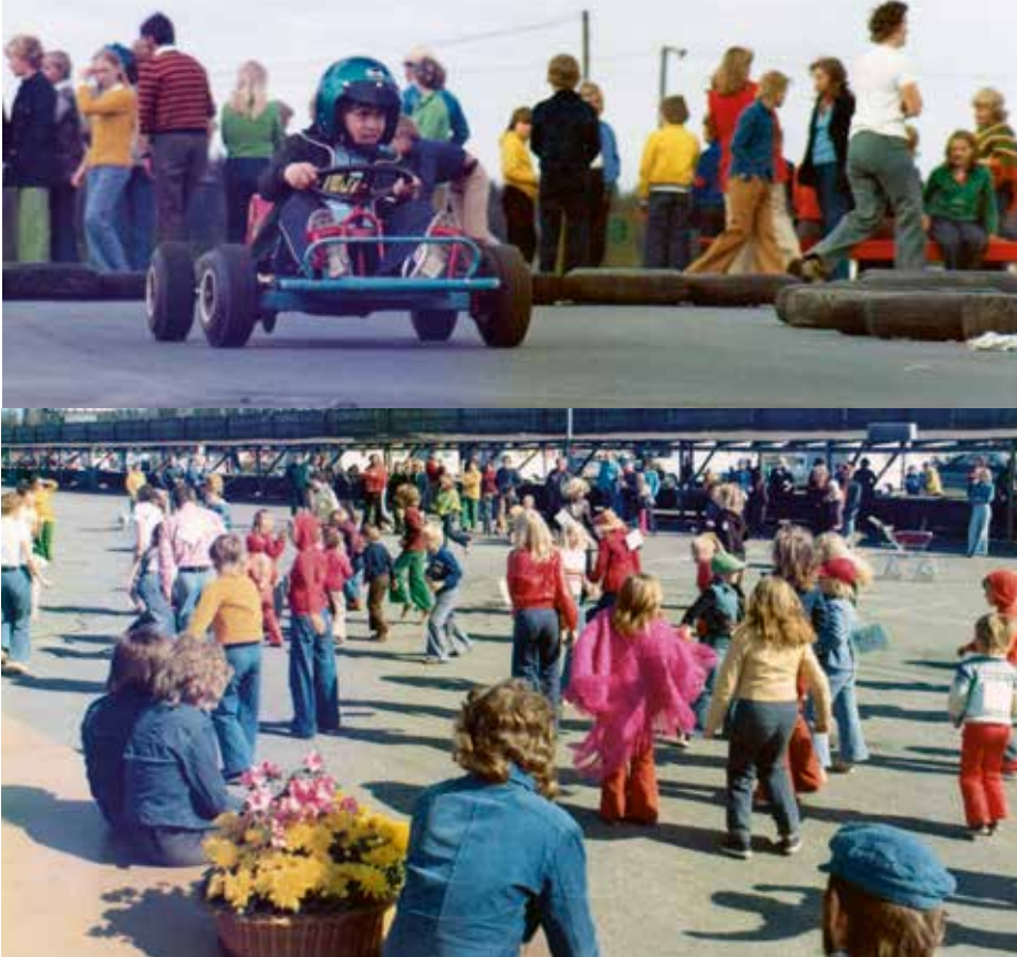
Lapsille oli Keimolassa järjestetty oma jytäjumppakisa