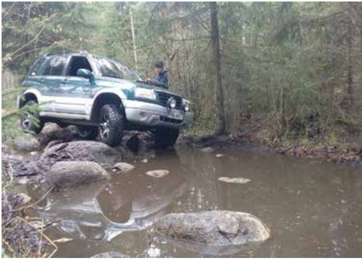
Lätäköiden syvyyttä ei voinut etukäteen tietää

hakemaan. Taaksepäin pääsi puolisen metriä ja ilmeisesti vieressä olevan kannon juuret esti taaksepäin pääsemisen. Siinä tovi jumiteltua auto lopulta liikahti eteenpäin ja tässä vaiheessa se saa happea vaan lisää. Muta lentää hienossa kaaressa ja Suzuki saavuttaa kuivan maan. Suzuki ainakin näytti perin katu-uskottavalta alan piireissä mutakerroksen myötä.