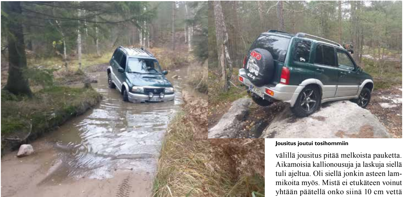
Reitillä riitti vesiesteitä.

Itse laitoin saman tien tilaukseen 75 mm korottavan alustasarjan. Suurin mahdollinen korotus, mitä lain mukaan voi tehdä kyseiseen menopeliin. Siinä tulee uudet jouset ja iskunvaimentimet, sekä muutama muu palikka sarjan asentamiseksi. Mielestäni tämä sarja ei kovin kallis ollut, kun kotiin kuskattuna se maksoi 600 €. Land Cruiseriin muinoin 50 mm korotussarja maksoi mukavat 1500 €. Tämä Suzukin sarja tietenkin pultattiin heti autoon, kun se vaan saapui. Onneksi oli saateeton viikonloppu, koska kotipihassa tuo sarja asennettiin. Suzukissa oli vakiona 31 cm maavaraa helman alla. Oletus oli, että nyt uuden sarjan kanssa maavara olisi 38,5 cm. Mutta maavara olikin 42 cm. Korotusta mukavat 11 cm alkuperäiseen. Tämä lämmitti erittäin paljon mieltä. Normaalaa suurempi korotus johtui todennäköisesti vanhoista jousista, jotka olivat jo vähän lassahtaneet. Eli auto oli alkuperäisillä jousilla normaalia matalampi. Suzukin alkuperäiset renkaat ovat kokoa 235/60-16. Laitoin tilaukseen 225/75-16 koossa olevat mutarenkaat ja ne tietenkin pultattiin auton alle myös. Uudet renkaat on n.50 mm suuremmat kuin alkuperäiset renkaat. Näin renkaiden myötä sai myös hieman lisää maavaraa. Extramaavara on aina plussaa.