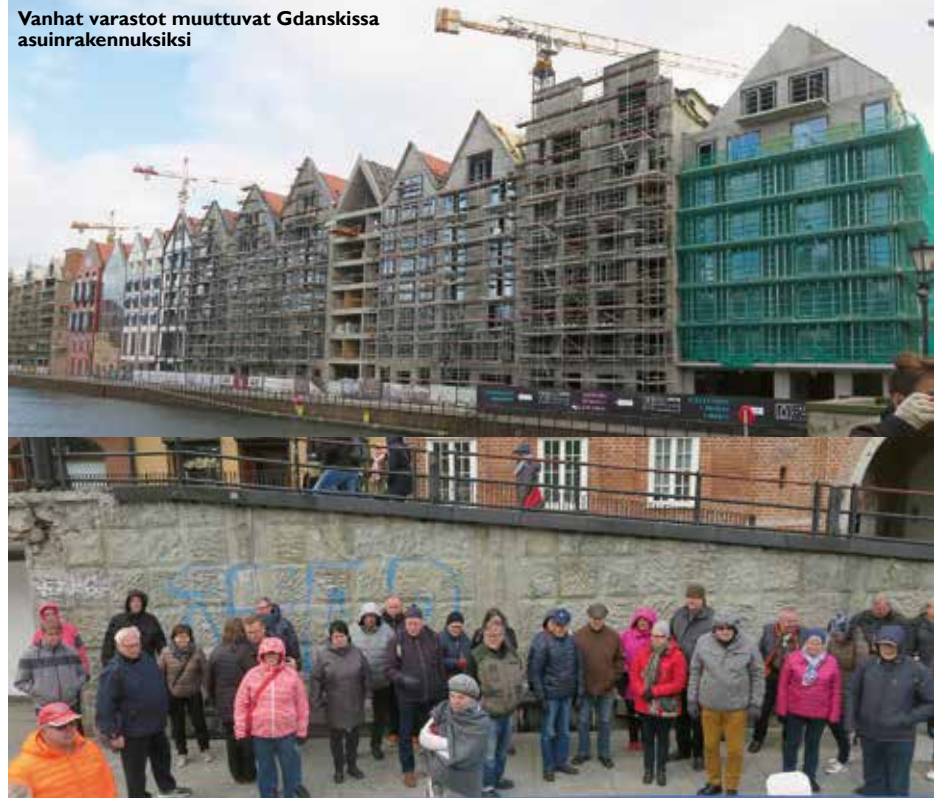
Vanhat varastot muuttuvat Gdanskissa asuinrakennuksiksi