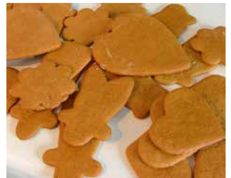
Piparkakut, joulun herkut

käytössä. Porkkanalaatikko on lanttulaatikkoon nähden varsin uusi tulokas, sillä sitä opeteltiin tekemään vasta 1900-luvun alkupuolella.