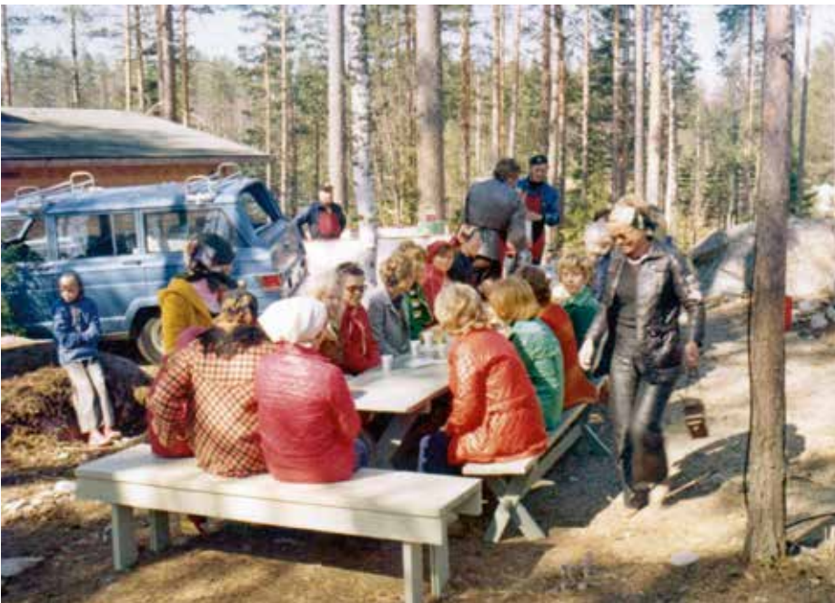
Pitkäpöytä Helsingin seudun Mäkijärven alueella vuonna 1974