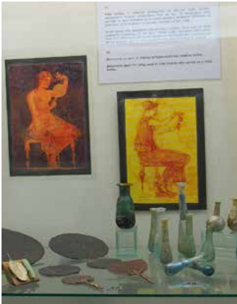
Museoarteita- lasisia hajuvesipulloja, käsipelejä ym. kauneudenhoitovälineitä antiikin ajalta

Iltarusko punasi söpösti maisemaa ja ikkunastamme avautuivat molemmilla puolilla maalaukselliset merinäkyvät. Mikä idylli! Maisema henki neitseellistä rauhaa. Leirinnän alareunassa kulki läpikulkutie kohti Losinjina tunnettua saaren vilkkaampaa päätösosuutta. Sekään ei häirinnyt. Liikenne melkein kuoli hämärän laskiessa.