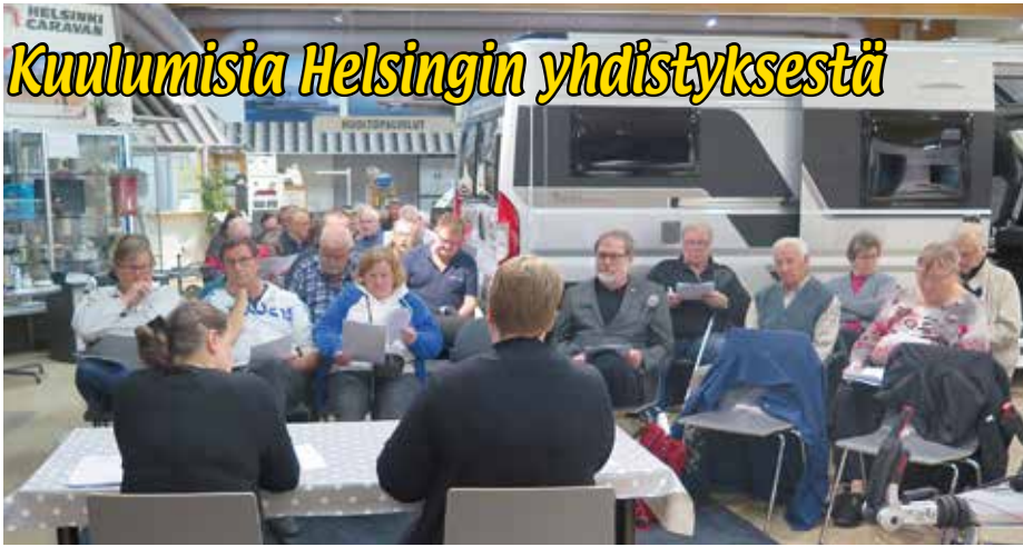
Kokousväkeä oli paikalla mukavasti