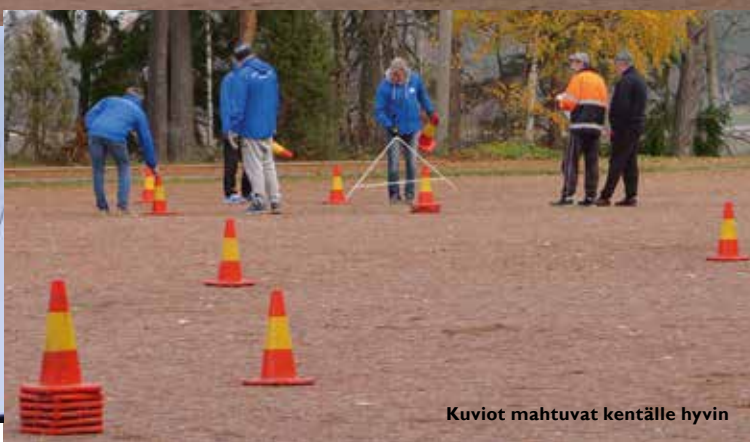
Kuviot mahtuvat kentälle hyvin