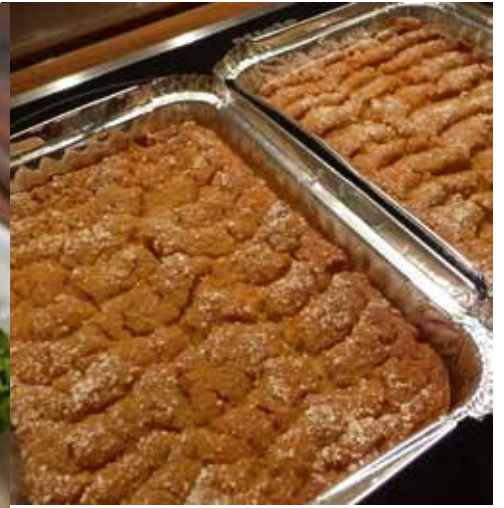
Lanttulaatikko on osa joulua

Kinkun kaveriksi ilmestyy usein lanttulaatikko mukanaan sekä peruna- että porkkanalaatikko. Lanttulaatikko on sekin vanha suomalainen perinneruoka, jota on syöty jo keskiajalta lähtien talouksissa, joissa on ollut uuni ja sopivat paistoastiat