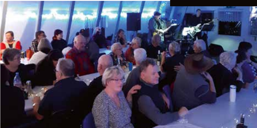
Ylisillä tanssittiin sekä laulettiin täydellä salilla molempina iltoina.

Katselin ja kuuntelin kauhulla tv-uutisia ja niissä kerrottuja säätietoja. Meidän treffiviikonlopuksi luvattiin pakkasia ja hurjia lumisateita. Ajattelin kauhulla, tuleekohan kukaan meidän Valojuhlatreffeille Vantaan Tallille.