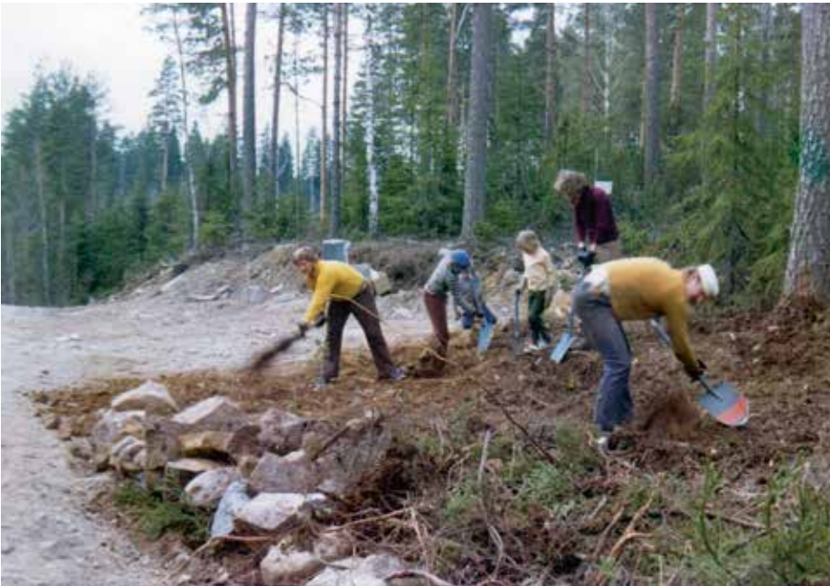
Helsingin seudun kerhon alueella Mäkijärvellä tehtiin talkoita vuonna 1974