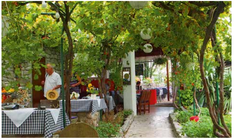
Kaupungista löytyy monta mukavaa ruokailupaikkaa