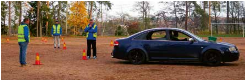
Vadista ei saisi lainkaan läikkyä vettä.