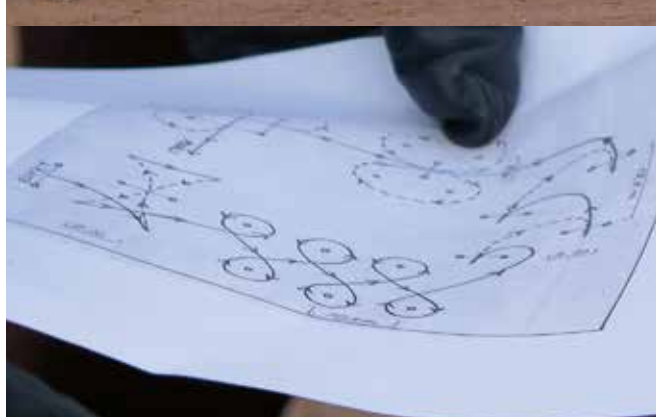
Ratapiirros vuodelta 1974