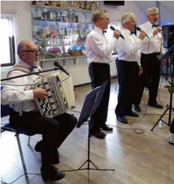
Nikke- ja Caravanpojat