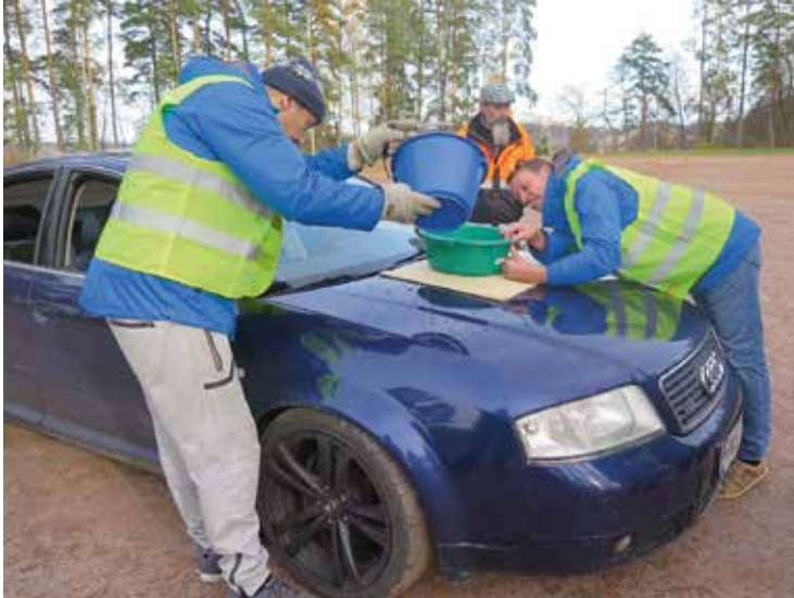
Vadin täyttö seuraavaa kilpailijaa varten